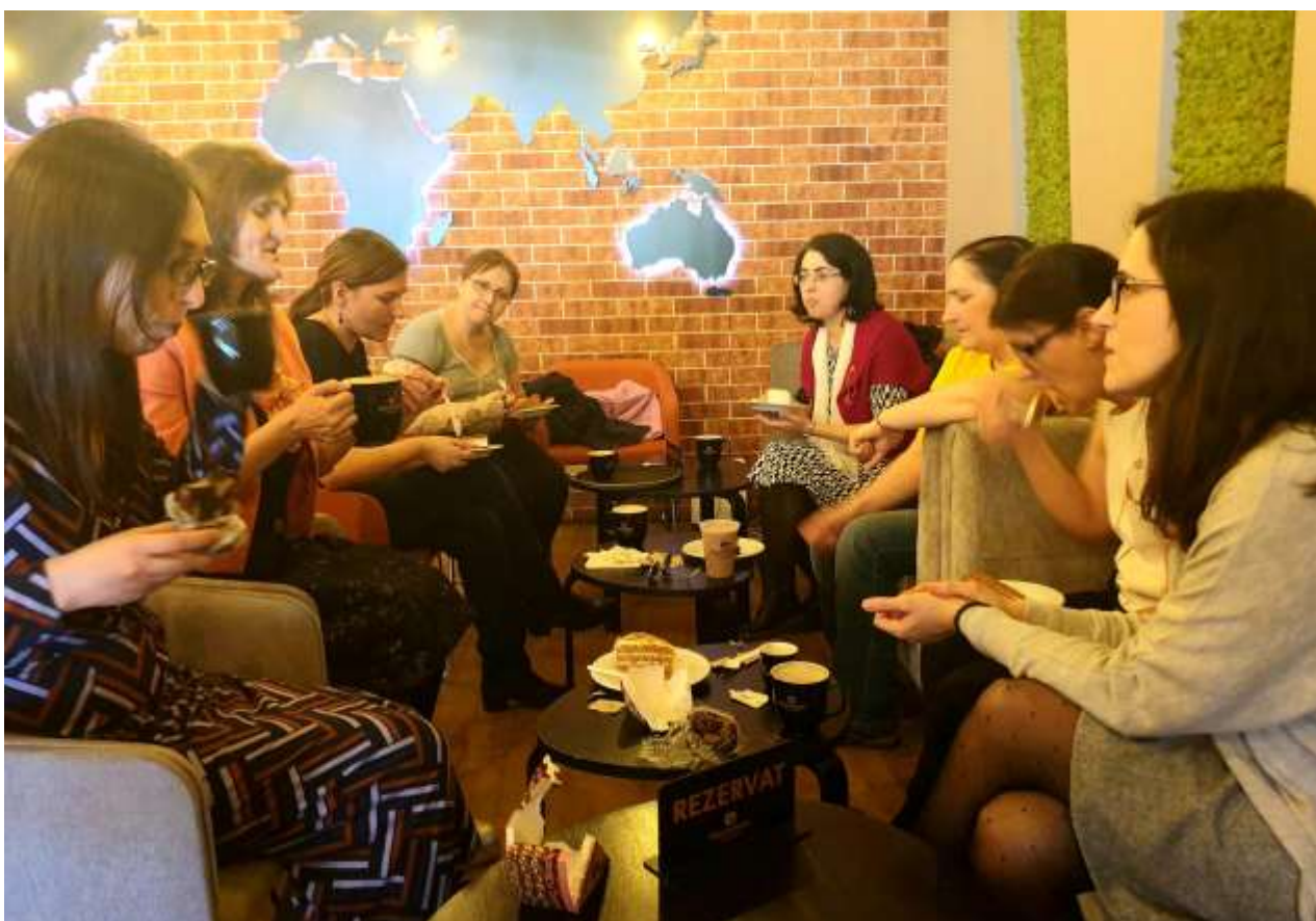
8 Martie 2020, ultima întâlnire fizică a anului în care am sărbătorit mamele adoptive

(Familie cu copii în plasament familial în proces de declarare a adoptabilității)